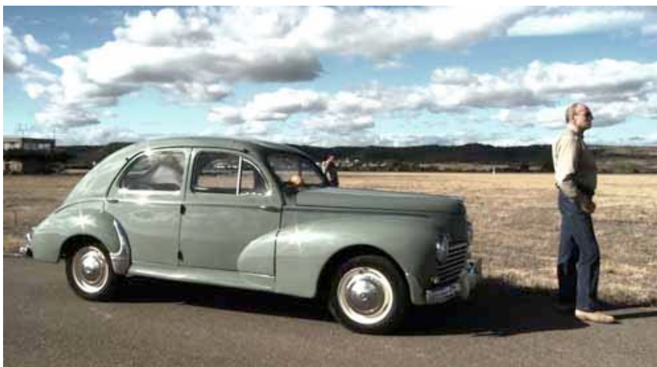
Christophe Herreros, Once Upon the End , 2009, vidéo